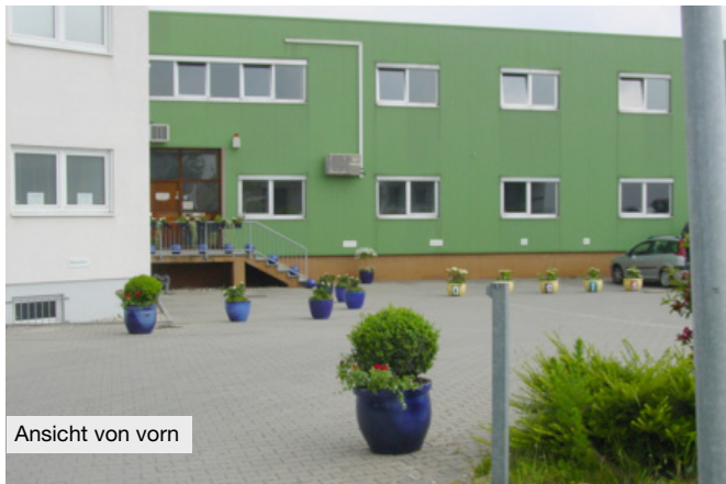
Ansicht von vorn

Um ein Geschäftsgebäude energetisch zu optimieren, muß es ähnlich einem Wohnhaus untersucht und auf die Ursachen