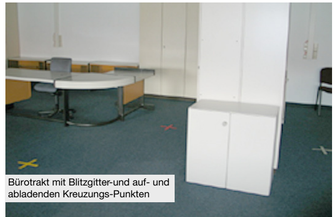
Bürotrakt mit Blitzgitter- und auf- und abladenden Kreuzungs-Punkten

In einem nächsten Schritt betrachten wir das Raum-Psychogramm, welches ein europäisches Analog-System zum Feng Shui ist und auf den Energien der Himmelsrichtungen basiert. Die Kraft der Richtungen erkennt ein Urmuster unseres Seins, im Innen wie im Aussen. Im Ursprung vieler Kulturen ist dieses Muster gleich dem Rad des Lebens mit Raum und Zeit enthalten (Medizinrad, Steinkreis, Kreistänze). Im vorliegenden Firmenkomples ist vom Eingang her gesehen die linke Seite die weibliche, die deutlich stärker ist als die rechte Seite, weil hier ein