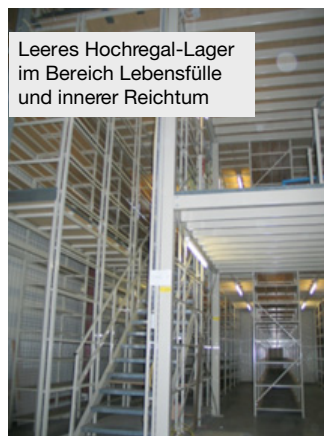
Leeres Hochregal-Lager im Bereich Lebensfülle und innerer Reichtum

Der energieschwächste Bereich ist der Eingang zum Hochregal-Lager (vom Firmen-Eingang her gesehen hinten links). Er wirkt wie eine dunkle, fast unheimlich finstere Höhle oder wie